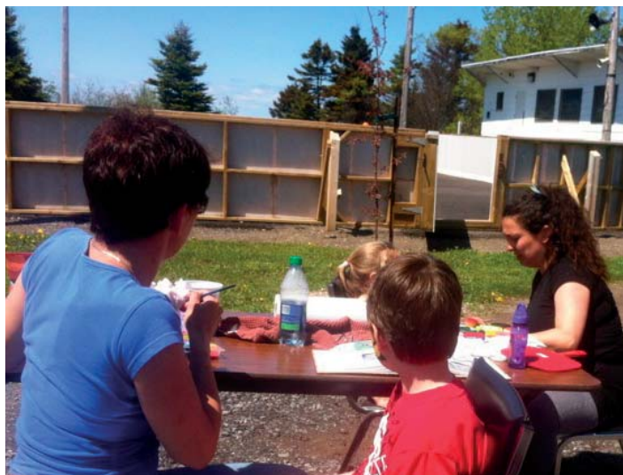
Maquillage des enfants.

Des hot-dog étaient offerts pour le dîner, du maquillage pour les enfants, un étalage de livres usagés, etc. Pierre Thibodeau, maire de Saint-Ulric, a fait une brève allocution pour souligner l'importance d'événements rassembleurs de ce genre pour tisser des liens entre les habitants d'une municipalité dynamique comme la nôtre. Sylvie Pelletier, une des organisatrices de la Fête, a chaleureusement remercié les bénévoles pour leur efficacité et leur dévouement. Encore une fois, rien ne serait possible sans leur implication. La bonne humeur régnait, une bien belle journée. À l'année prochaine chers voisins!