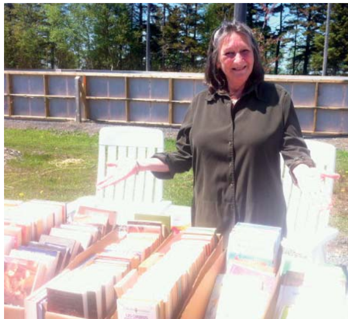
Marché aux puces.